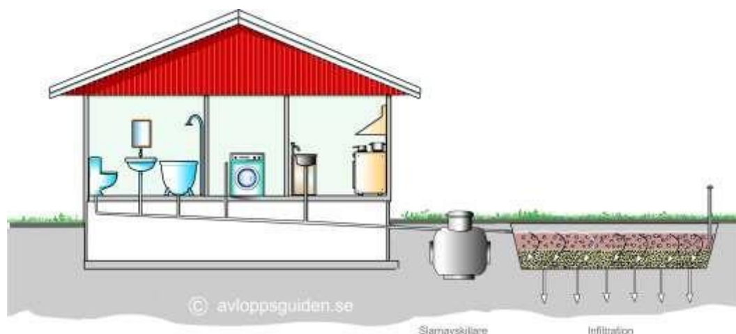
Bild 1: Infiltrationsanläggning för WC- och BDT-avloppsvatten.

Om grundvattennivån eller berggrunden i området ligger för ytligt men marken i övrigt är lämpad för infiltration kan en upplyft och förstärkt infiltration vara en tänkbar lösning. Infiltrationsledningarna läggs då ovan markytan efter tillförsel av markbäddssand. Det är då viktigt att anläggningen skyddas från frost och tätas på sidorna ner till befintlig marknivå.