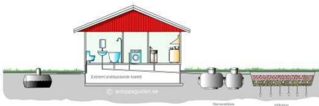
Bild 4: Sluten tank för WC samt infiltrationsanläggning för BDT.

Om urinsorterande torrtoalett, mulltoa eller sluten tank för WC används, måste BDT, Bad-, Disk- och Tvättvatten, tas om hand i antingen grävattenfilter, markbädd eller infiltration. För närmare information om markbädd och infiltration, se ovan.